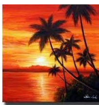
Esto es un ejemplo, no realizar