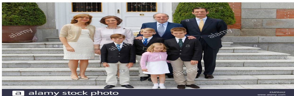
Familia Real Española 2011